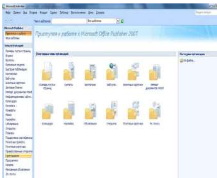
Рис. 2. Типы публикаций

Создание односторонней визитной карточки следующее, области задач Типы публикаций выбрать параметр Визитные карточки (рис. 2).